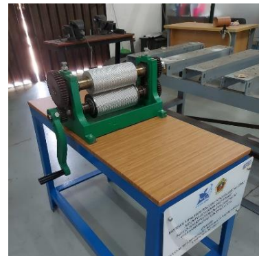
Gambar 7. Alat pembuat pondasi sarang lebah

Adapun prosedur kerja yang akan diimplementasikan pada program kegiatan pengabdian masyarakat ini dijabarkan pada tabel 2 prosedur kerja program berikut ini: