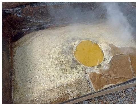
Gambar 1. Proses pembuatan began baku untuk cetakan pondasi sarang lebah

Madu adalah senyawa alami yang dihasilkan dan disimpan dalam sarang madu oleh binatang lebah dengan kandungan karbohidrat yang mencapai 95-97% terhadap bobot kering madu [1]. Madu bersifat antibakteri, antiradang, dan antijamur. Selain itu pada beberapa penelitian disampaikan bahwa madu dapat meningkatkan sistem imun tubuh [8], memiliki efek antibakteri [2], efek antioksidan [5] serta efek antiinflamasi [4]. Desa Kandangmas yang berlokasi di kecamatan Dawe kabupaten Kudus dan tepatnya di lereng pegunungan Muria merupakan salah satu desa yang dikenal dengan budidaya madunya. Di desa Kandangmas kelompok pembudidaya madu tersebut tergabung dalam paguyuban pembudidaya lebah madu desa Kandangmas.