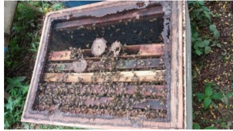
Gambar 2. Kotak sarang lebah /Stup terdiri 8-9 slot sarang lebah

Dalam proses panen madu, kendala yang saat ini dialami adalah proses produksi sarang lebah atau yang lebih dikenal dengan pondasi sarang lebah. Secara alami proses pembuatan sarang lebah tersebut akan dibuat oleh koloni lebah itu sendiri. Akan tetapi saat ini pondasi sarang lebah tersebut juga dapat dibentuk secara manual sehingga akan membantu lebah agar lebih cepat berproduksi tanpa harus membuat sarang lebah sendiri secara alami. Dengan pembuatan pondasi sarang lebah buatan tentunya dapat mempercepat proses produksi madu dari lebah karena lebah tidak harus membuat sarangnya terlebih dahulu ketika akan memproduksi madu. Diharapkan melalui program kegiatan pengabdian masyarakat ini dapat meningkatkan kuantitas produksi madu dari kawasan pegunungan Muria. Sehingga pada akhirnya pendapatan dan kesejahteraan para peternak lebah madu di paguyuban pembudidaya lebah madu desa Kandangmas ini dapat meningkat dengan lebih baik lagi.